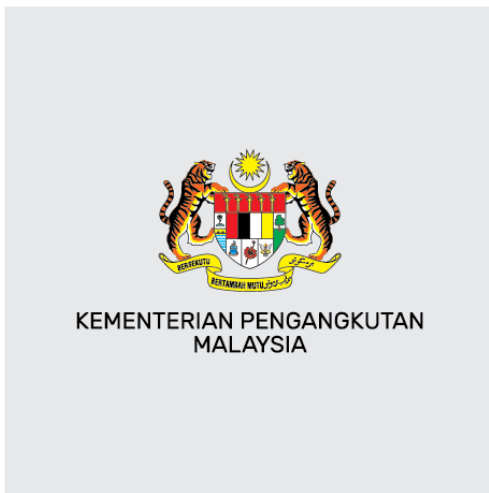
Latar belakang : CERAH