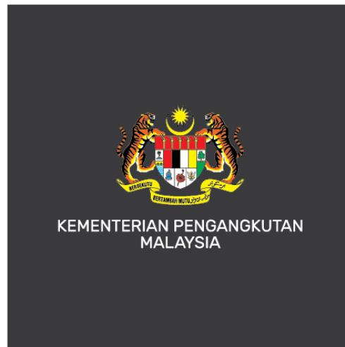
Latar belakang : GELAP