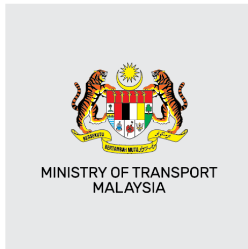
Latar belakang : CERAH