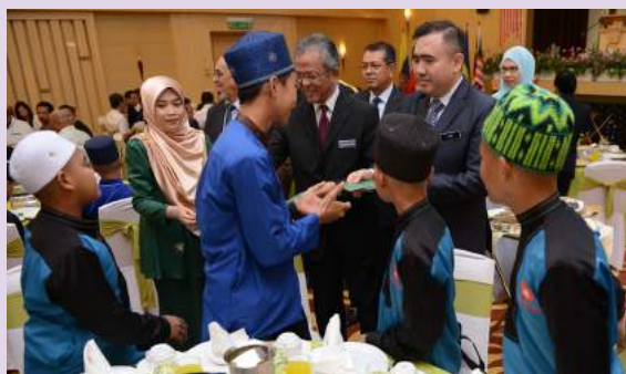
Menteri Pengangkutan, YB Loke Siew Fook dan Timbalan Menteri Pengangkutan, Dato' Haji Kamarudin Jaffar menyampaikan sumbangan duit raya kepada para pelajar dari Pusat Kebajikan, Pendidikan Dan Tahfiz Baitul Ukhfaz Seri Kembangan, Selangor

Majlis yang dihadiri kira-kira 1,000 orang warga MOT serta jabatan dan agensi turut dimeriahkan dengan kehadiran para pelajar dari Pusat Kebajikan, Pendidikan Dan Tahfiz Baitul Ukhfaz Seri Kembangan, Selangor serta wakil media cetak dan elektronik.