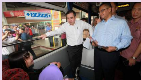
YB Menteri Pengangkutan berkesempatan menemubual beberapa penumpang wanita perkhidmatan bas ekspres Seremban-Kuala Lumpur semasa lawatan ke Stesen Bas Terminal One Seremban

Syarikat bas ekspres yang menawarkan perkhidmatan laluan Kuala Lumpur<=>Seremban kini perlu menyediakan perkhidmatan bas khas untuk penumpang wanita pada waktu puncak. Ini kerana pada masa ini kira-kira 2,000 orang menggunakan perkhidmatan bas ekspres antara dua destinasi itu pada waktu puncak.