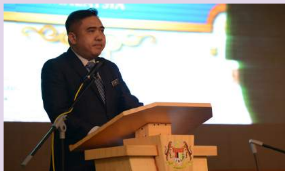
Menteri Pengangkutan, YB Loke Siew Fook menyampaikan ucapan sempena Perhimpunan Bulanan MOT Bulan Jun 2019

Kementerian Pengangkutan Malaysia (MOT) telah mengadakan Perhimpunan Bulanan MOT Jun 2019 pada 19 Jun 2019 bertempat di Dewan Gunasama, Aras 2, Kementerian Pengangkutan Malaysia yang diadakan bersekali dengan Majlis Ramah Mesra Bersama Menteri Pengangkutan, YB Loke Siew Fook.