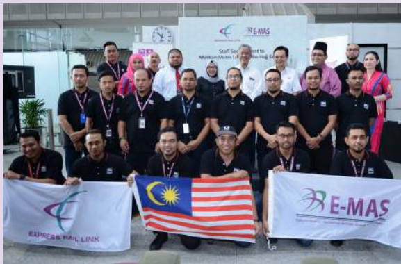
Sebahagian daripada 28 orang kakitangan ERL dan E-MAS yang bakal dihantar bertugas selama dua bulan bagi menyokong operasi Makkah Metro pada musim haji pada tahun ini

Perjanjian kerjasama dengan pemain industri tempatan oleh Terberg Group Royal Dutch menerusi Terberg Tractors Malaysia merupakan langkah yang sangat proaktif. Kajian traktor terminal autonomi akan memberikan pengetahuan penting yang bukan sahaja dapat meningkatkan kecekapan operasi PTP malah bakal membuka kemungkinan baru untuk PTP berada di barisan hadapan industri. Pengilang trak terkenal dunia ini juga turut bersedia untuk berkongsi pengetahuan luas dan teknologi canggih mereka dengan mana-mana universiti tempatan Malaysia.