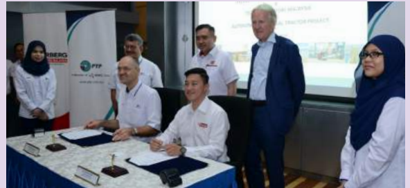
Majlis menandatangani MoU antara Pelabuhan Tanjung Pelepas (PTP) dan Terberg Tractors Malaysia (TTM) pada 18 Jun yang lalu telah disaksikan oleh YB Menteri Pengangkutan

Langkah PTP ini merupakan satu penambahbaikan yang akan memastikan pelabuhan itu berdaya saing di peringkat antarabangsa. Inisiatif ini turut menyumbang kepada misi untuk mengukuhkan sistem pengangkutan yang didorong oleh teknologi yang juga akan bertindak sebagai pemangkin pembangunan negara.