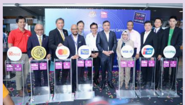
'Kempen Penggunaan Pengangkutan Awam Tanpa Tunai' anjuran ERL mendapat kerjasama Boost e-wallet, GrabPay, Mastercard, Maybank, Touch 'n Go, UnionPay dan Visa

YB Menteri Pengangkutan juga menggalakkan operator pengangkutan awam memanfaatkan analisa data melalui sistem tanpa tunai berkenaan dalam usaha memperkenalkan harga dinamik di samping meningkatkan jumlah pengguna pengangkutan awam dan memudahkan perjalanan mereka. Kempen ini dianjurkan oleh Express Rail Link Sdn Bhd (ERL) dan hasil kerjasama dengan Boost e-wallet, GrabPay, Mastercard, Maybank, Touch 'n Go, UnionPay dan Visa.