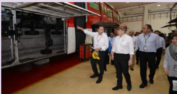
Menteri Pengangkutan, YB Loke Siew Fook dibawa meninjau dan diberi taklimat mengenai status terkini kerja-kerja membaik pulih 5 set tren Rapid KL Laluan Monorel

Pada 11 Jun 2019, Menteri Pengangkutan, YB Loke Siew Fook telah mengadakan lawatan pemeriksaan ke Depoh Monorel di Brickfields bagi meninjau kerja-kerja membaik pulih 5 set tren 4-gerabak Rapid KL Laluan Monorel yang telah diberhentikan operasinya sejak Januari tahun lepas. Pemeriksaan ini bertujuan untuk memastikan kerja-kerja menaiktaraf set tren ini dapat dijalankan mengikut jadual yang telah ditetapkan.