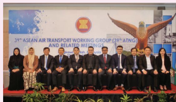
Antara peserta negara anggota ASEAN yang hadir di Mesyuarat Ke-39 Kumpulan Kerja Pengangkutan Udara ASEAN

Antara perkara-perkara yang dibincangkan semasa ATWG adalah menyentuh aspek ekonomi dalam industri penerbangan, teknikal dan keselamatan, liberalisasi sektor perkhidmatan udara, pembangunan kompetensi dan latihan, pematuhan standard dan regulasi, perkongsian maklumat dan kepakaran serta kerjasama ASEAN dengan rakan dialog (ASEAN Dialogue Partners) dalam industri penerbangan awam seperti ASEAN-China, ASEAN-India, ASEAN-Jepun, ASEAN-Republik Korea, ASEAN-Kesatuan Eropah dan ASEAN-Amerika Syarikat.