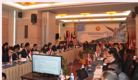
Penganjuran Mesyuarat Ke-39 Kumpulan Kerja Pengangkutan Udara ASEAN membuktikan komitmen dan kemampuan negara menganjurkan acara antarabangsa

Malaysia melalui Kementerian Pengangkutan (MOT) telah menganjurkan Mesyuarat Ke-39 Kumpulan Kerja Pengangkutan Udara ASEAN (39th ASEAN Air Transport Working Group – ATWG) di Hotel Adya, Langkawi pada 22-25 April 2019. ATWG merupakan mesyuarat tahunan yang diadakan sebanyak 2 kali setahun bagi tujuan membincangkan pelbagai isu yang menyentuh mengenai pengangkutan udara dalam kalangan negara-negara ASEAN. Malaysia melalui MOT telah terlibat secara aktif dalam membincangkan kerjasama sektor pengangkutan udara melalui ATWG dan mesyuarat-mesyuarat sub-working group di bawahnya.