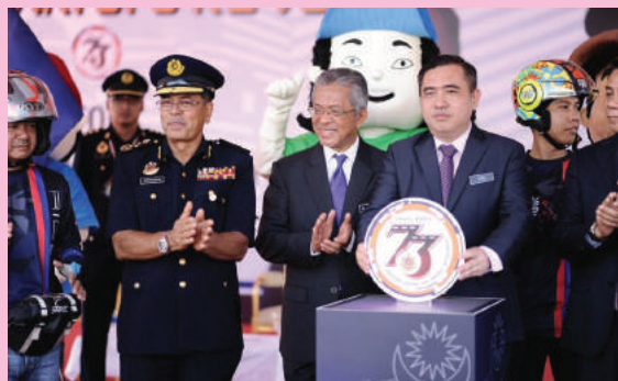
Menteri Pengangkutan, YB Loke Siew Fook menyempurnakan gimik pelancaran Majlis Sambutan Hari Jabatan Pengangkutan Jalan (JPJ) yang ke-73 tahun