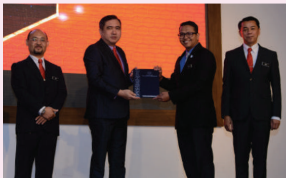
Menteri Pengangkutan, YB Loke Siew Fook menyampaikan Anugerah Perkhidmatan Cemerlang (APC) 2018 kepada salah seorang penerima anugerah tersebut

Majlis ini diadakan adalah sebagai pengiktirafan bagi menghargai sumbangan warga MOT, jabatan dan agensi di bawah MOT yang telah menunjukkan prestasi cemerlang sepanjang tahun 2018. Selain itu, penghargaan turut diberikan kepada pesara dan bakal pesara bagi bulan Januari hingga Jun tahun ini di atas jasa serta khidmat bakti yang dicurahkan sepanjang mereka berkhidmat.