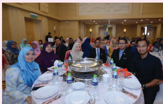
Sebahagian daripada 86 orang pegawai dan kakitangan serta 65 orang pesara yang telah diraikan dalam Majlis Anugerah Perkhidmatan Cemerlang (APC) 2018 dan Jasamu Dikenang 2019

Seramai 86 orang pegawai dan kakitangan serta 65 orang pesara dan bakal pesara kementerian dan jabatan serta agensi di bawah Kementerian Pengangkutan Malaysia (MOT) telah diraikan dalam Majlis Anugerah Perkhidmatan Cemerlang (APC) 2018 dan Jasamu Dikenang 2019. Majlis yang telah diadakan pada 19 April 2019 ini disempurnakan oleh Menteri Pengangkutan, YB Loke Siew Fook bertempat di Dewan Serbaguna MOT.