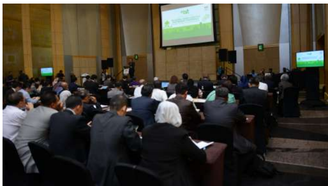
Pemain industri logistik berkolaborasi untuk mencapai amalan terbaik serta berkongsi pengalaman untuk mencapai kecekapan logistik serta mengurangkan pelepasan karbon