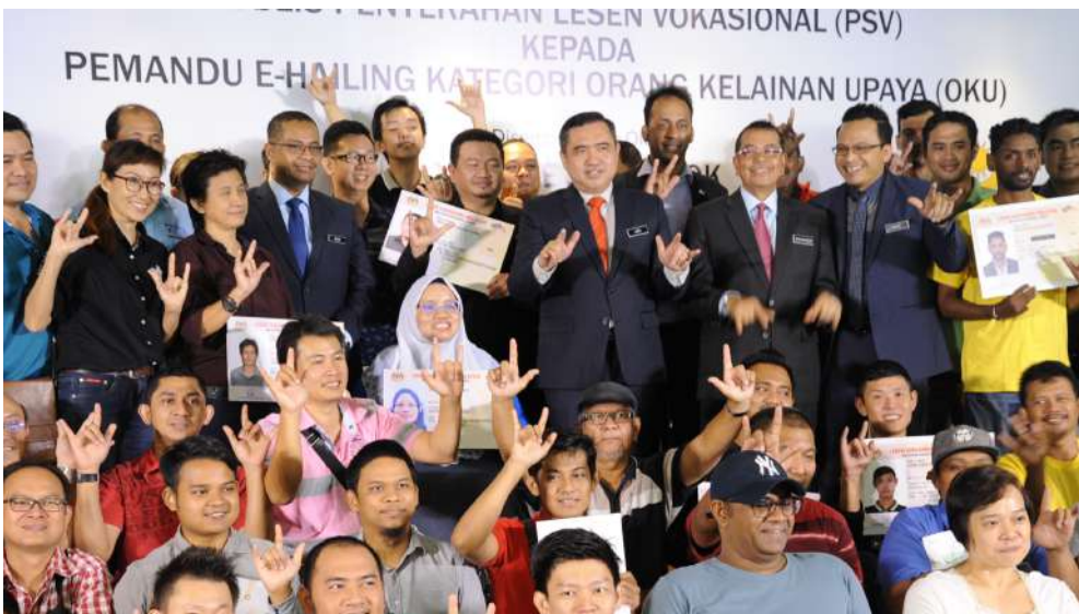
YB Loke Siew Fook bersama-sama dengan penerima Lesen Vokasional Kenderaan Perkhidmatan Awam (PSV) pemandu e-hailing kategori Orang Kelainan Upaya (OKU)

BANDAR UTAMA, 9 Julai 2019 - Kementerian Pengangkutan telah berbesar hati menyerahkan Lesen Vokasional Kenderaan Perkhidmatan Awam (PSV) kepada 209 orang pemandu e-hailing kategori Orang Kelainan Upaya (OKU).