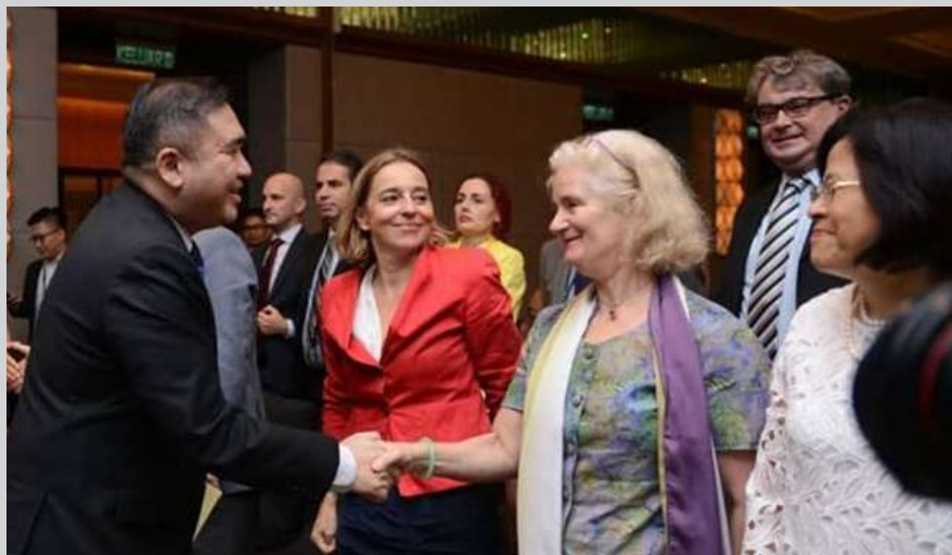
YB Loke Siew Fook bersama-sama duta-duta, Pesuruhjaya Tinggi dan pemain industri penerbangan di Majlis Resepsi Minum Petang ICAO Kategori III Bagi Penggal 2019-2022