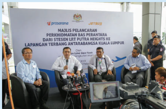
Sidang media YB Menteri Pengangkutan selepas Majlis Pelancaran Perkhidmatan Bas Perantara dari Stesen LRT Putra Heights ke KLIA dan klia2