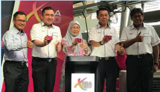
Semua penumpang perkhidmatan KTM Komuter warganegara Malaysia boleh menggunakan kad Xtra20 dan menikmati diskaun tambahan 20 peratus bermula 1 April 2019

Xtra20 adalah merupakan satu usaha kerajaan untuk menampung kos sara hidup para pengguna perkhidmatan komuter warganegara Malaysia yang dijangka mampu merangsang peningkatan penumpang KTM Komuter pada tahun ini dan tahun yang akan datang. Kementerian Pengangkutan mensasarkan peningkatan sebanyak 20 peratus pada tahun 2019 iaitu daripada lebih kurang 90,000 penumpang sehari kepada 108,000 penumpang sehari dan seterusnya tambahan 20% pada tahun 2020 demi mencapai sasaran 130,000 orang penumpang sehari dengan konsisten.