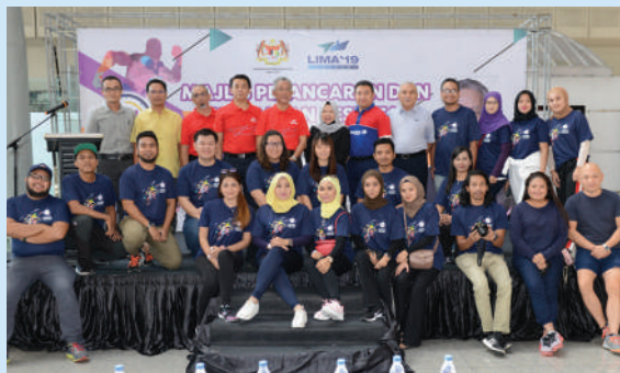
Para peserta Program 24 Hours Challenge #funtasticLIMA19 bergambar kenang-kenangan di Majlis Pelancaran dan Pelepasan Peserta di Balai Ketibaan KLIA Ekspres KL Sentral