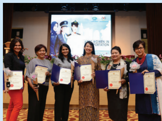
Di antara peserta 'APEC Women in Transportation' yang menerima penghargaan kerana telah terlibat dalam menjayakan program tersebut

Program bertujuan memartabatkan pemberdayaan wanita atau 'women empowerment' dalam sektor pengangkutan serta industri pelabuhan dan mewujudkan kesedaran untuk menangani masalah ketidakseimbangan jantina di tempat kerja. Selain itu, diadakan juga penyampaian kit program 'APEC Women in Transportation (WiT) Mentoring Programme'.