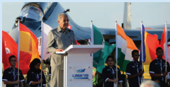
YAB Perdana Menteri Malaysia, Tun Dr. Mahathir Mohamad ketika menyampaikan ucapan pada majlis perasmian LIMA'19 di Mahsuri International Exhibition Centre (MIEC) Langkawi

LIMA'19 yang berlangsung pada 26 hingga 30 Mac 2019 telah dirasmikan oleh YAB Perdana Menteri Malaysia, Tun Dr. Mahathir Mohamad pada 26 Mac 2019 menyaksikan sektor komersil masih lagi menjadi fokus utama Kementerian Pengangkutan sebagaimana edisi-edisi LIMA yang lalu.