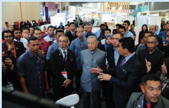
YAB Perdana Menteri Malaysia, Tun Dr. Mahathir Mohamad berkesempatan meluangkan masa berkunjung ke Pavilion MOT LIMA'19 di Mahsuri International Exhibition Centre (MIEC) Langkawi

Penganjuran LIMA'19 pada kali ini diadakan di dua tempat yang berasingan di mana pameran aeroangkasa diadakan di Mahsuri International Exhibition Centre (MIEC), manakala pameran maritim diadakan di Resorts World Langkawi. Antara negara yang mengambil bahagian sebagai pempamer adalah Turki, Rusia, United Kingdom, Amerika Syarikat, China, Perancis, Australia, Belarus, Jepun, Jerman, Slovakia dan Ukraine.