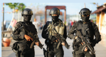
Antara gambar-gambar yang sempat dirakam sepanjang LIMA'19 di Mahsuri International Exhibition Centre (MIEC) dan Resorts World Langkawi