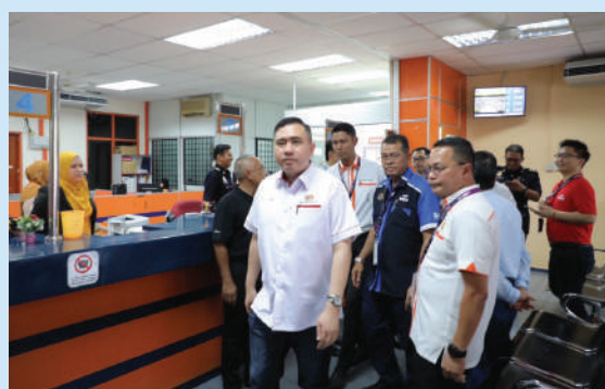
Menteri Pengangkutan, YB Loke Siew Fook meninjau pengoperasian kaunter JPJ Cawangan Langkawi sempena lawatan kerja beliau ke pejabat tersebut

Tel : 03 8323 8000 · Faks : 03 8888 8806