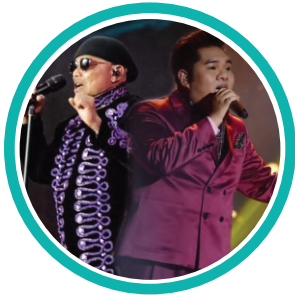
PERSEMBAHAN ARTIS JEMPUTAN