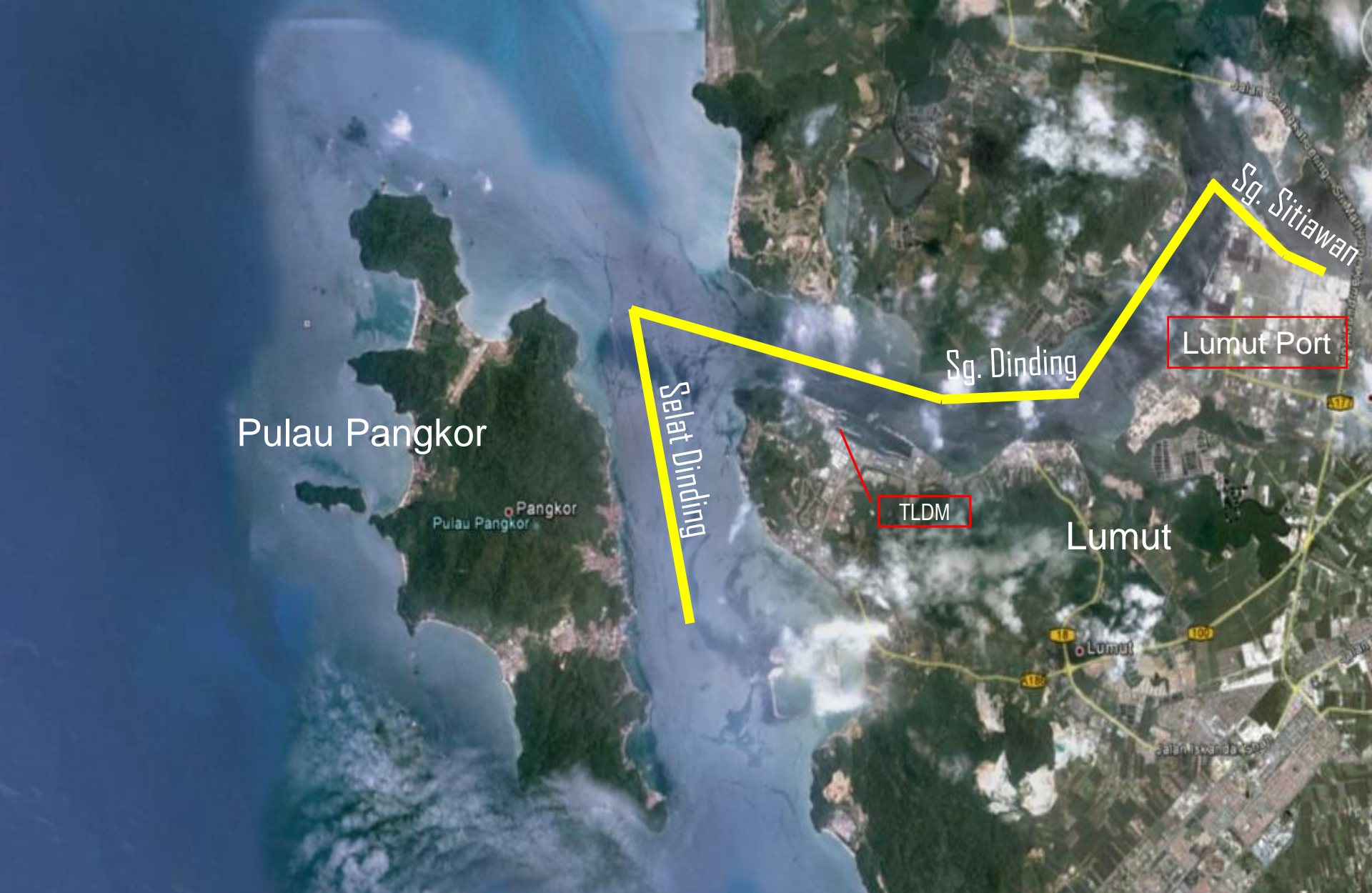
Alur Pelayaran Kapal di Selat Dinding, Sg. Dinding dan Sg. Sitiawan