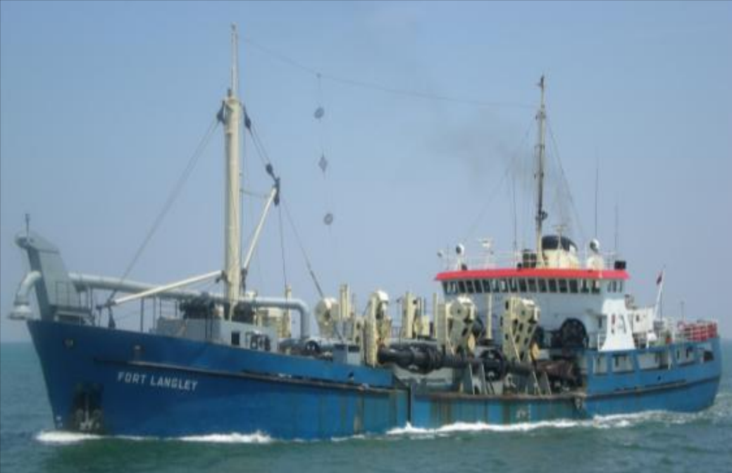
Trailing Suction Hopper Dredger