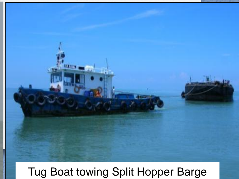
Tug Boat towing Split Hopper Barge